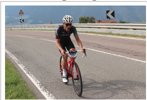
Juli 2019 Gesamtsieger