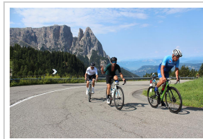
Juli 2019